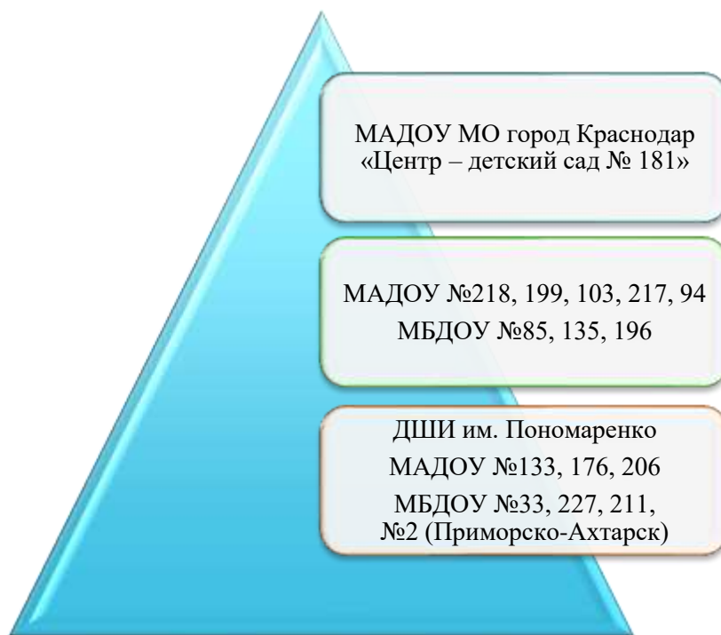
Рисунок 2 – Сетевое объединение МСИП

На рисунке 2 отображено сетевое объединение МСИП по теме «Современные подходы к художественно-эстетическому развитию дошкольников в соответствии с требованиями ФГОС ДО»